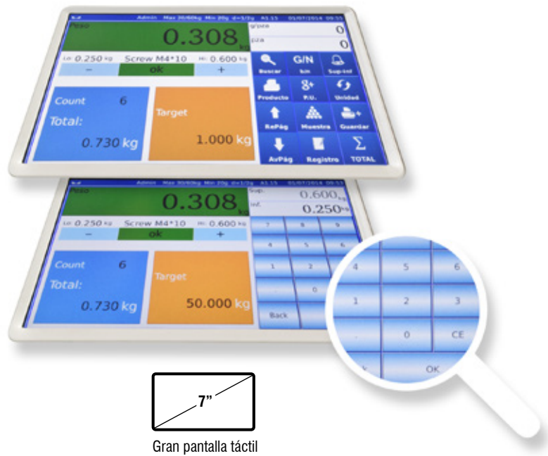
7" Gran pantalla táctil