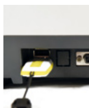
Salida RS232 y USB