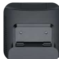
Estándar VESA 75 * 75