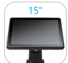
15 inch 1024*768