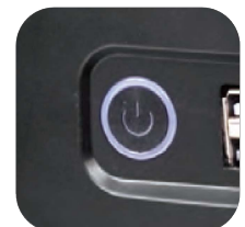
Indicador de encendido azul claro