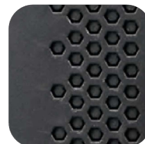
Ventilaciones de estilo de diseño de panel